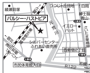
パルシー・ハストピア 蓮田市大字間戸2343