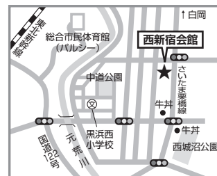
西新宿会館 蓮田市西新宿2-129-1